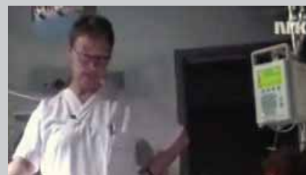
Bilde frå programmet.