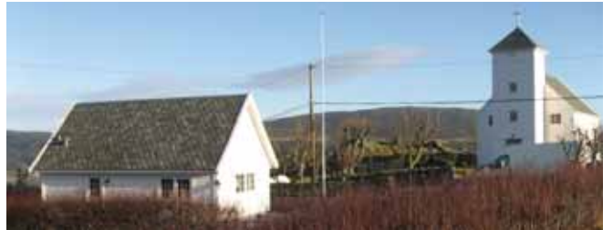
Det nye bårehuset ligg like ved inngangen til kyrkjegarden.

Det gamle bårehuset skal nå fungera som reidskaphus, noko dei som arbeider på kyrkjegarden er svært glade for.