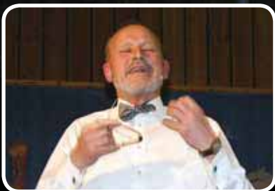
«Jakten på helsens kilde» – s. 8