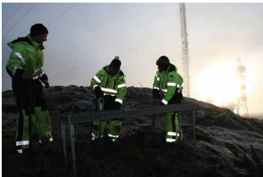
Presisjonsarbeid i det sola bryt gjennom.

Arbeidet er no starta og som bileta viser, er ein i full gong med førebuingane for plasseringa av dei 8 benkene som skal setjast opp. 4 av desse skal fungera som benker medan 4 av dei skal fungere som kombinert benk/informasjonstavle. Dei 4 sistnemnde benkene skal plasserast i dei 4 himmelretningane og på informasjonstavla skal ein finna forteljinga om kva ein ser, i så lende. I tillegg har ein allereie gjort grunnarbeida, støypt betongplata samt lagt ut skiferen ("smykket") som dannar platået. Det vart nemnd seinast no i dag: "Ein konsert med "The Kvednabekkers" hadde gjort seg der!"