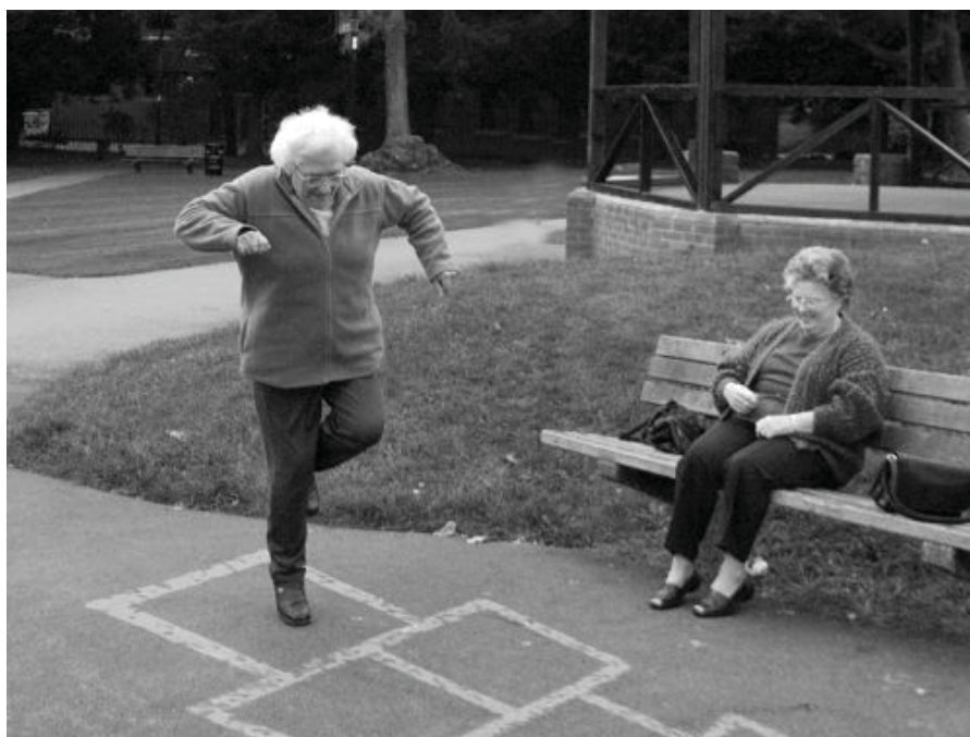
Bilde frå brosjyra som omhandlar prosjektet.

Med utgangspunkt i de erfaringene og det materialet som enkelte norske