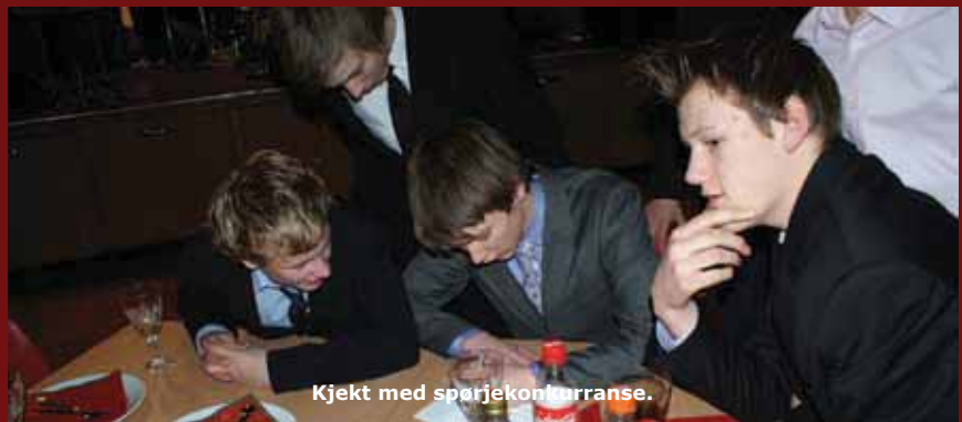
Kjekt med spørjekonkurranse.