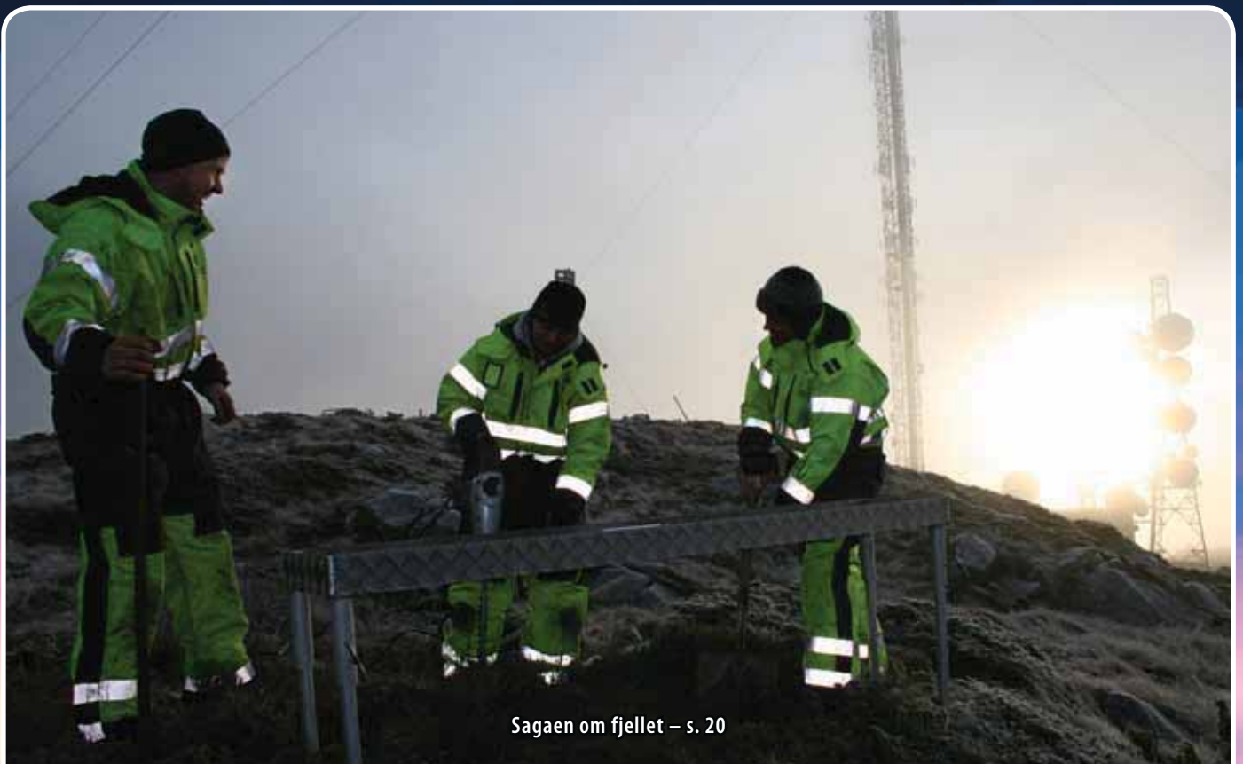
Sagaen om fjellet – s. 20