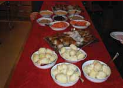
Masse god mat.

Allereie i september tok eg føre meg lista på førebuingar for julemiddagen. Eg ville ha band til å spele, både pinnakjøtt og ribbe, og eit greitt lokale til å vere i. Usikkerheita var stor til å begynne med, men eg landa på den goe gamle skulen til slutt. Og det var ikkje nei i nokon sin munn, då eg spurde meg føre både om lokale, hjelperar