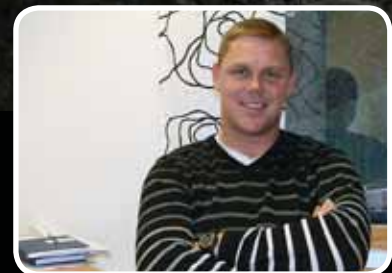
Ny saksbehandlar – s. 24