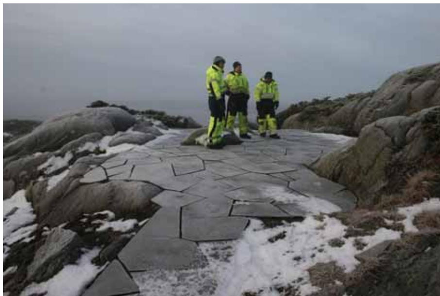
Utsiktspunktets "smykke": Skiferbelagt platå.

Arbeidet med utforminga av utsiktspunktet vart, av formannskapet, delegert til arbeidsgruppa "Ta naturen i