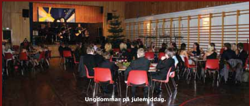
Ungdommar på julemiddag.