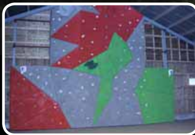
Stor klatrevegg i Bokn – s. 19