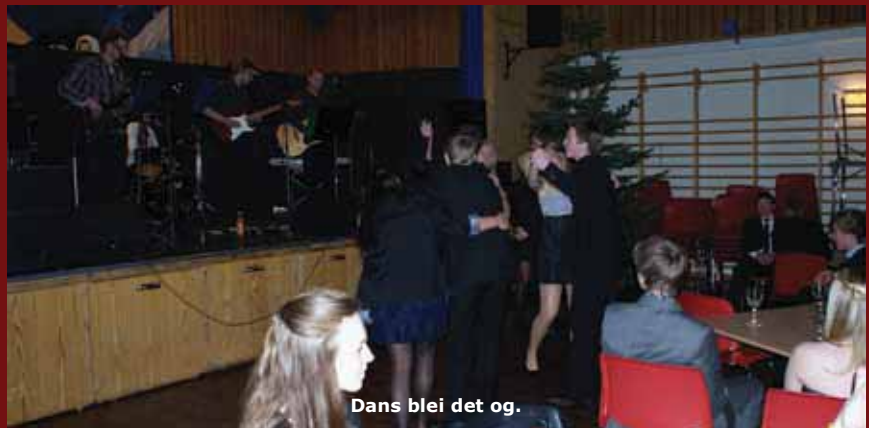
Dans blei det og.