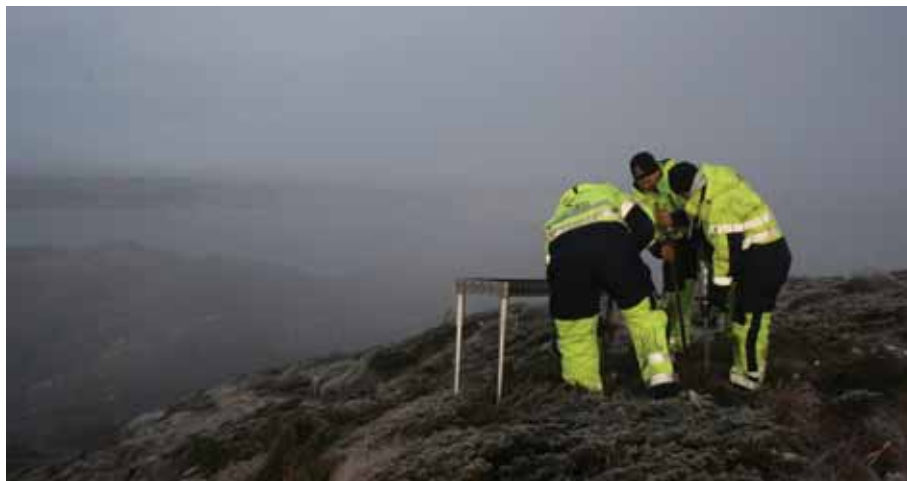
Førebuingar for plassering av benker.

Kjære boknar, tysværbu, haugesundar, karmøybu – og kjære siddis: Arbeidet er i gong. Maskinane er frakta opp – og nokre av dei; ned att. Med streng beskjed frå prosjektleiaren for Kjekt på Bokn: "Køyr no endeleg varsamt opp og ned den bratte fjellsida. Vi er redde for dykk. De arbeider under "ekstreme forhold" – og vi er difor ekstra imponerte over entusiasmen de likevel viser over arbeidet med Utsiktspunkt Boknafjell. Eit genuint engasjement; eit som kjem frå hjarta."