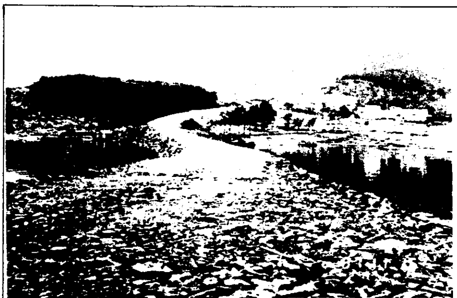
Parsell av den nye rv. 512 ved Susort fra fyllinga og innover mot land.

Men trass i dette - dei fleste syntes nok det var ein fin tur - og eit bra tiltak frå Bokn kommune som arrangerte turen.