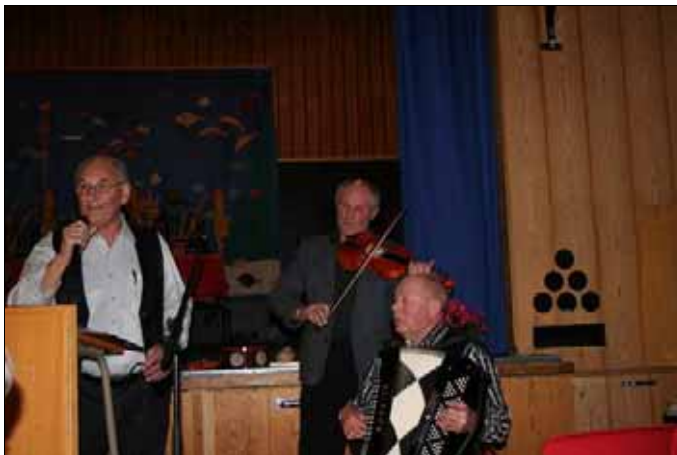
Song og musikk laga god stemning.

Vi fikk servert smørbrød, brus og kaffe. Spørrekonkurranse med premie hører også til.