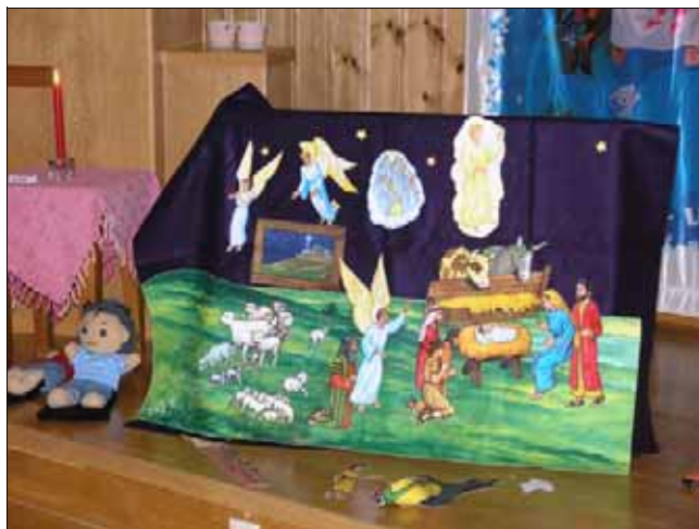
Flanellografen er framleis eit fast innslag på sundagsskulen

Dei drøfta dette i soknerådet som dei begge er medlemmer av, og bestemte seg for å prøva på nytt annakvar sundag. Neste gong blir over nyttår. Det er 2 år sidan det sit var fast sundagsskule her.