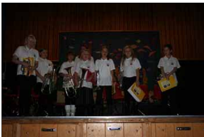
Takk til aspirantane!

Korpset har all ære av arrangementet som gikk knirkefritt ut fra mitt ståsted. En hyggelig stund jeg gjerne gjentar neste år!