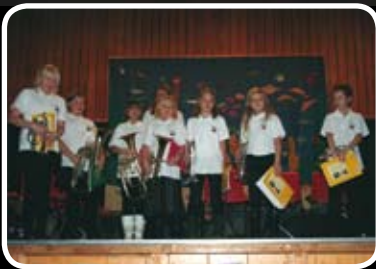
Luciafest – les meir s. 3