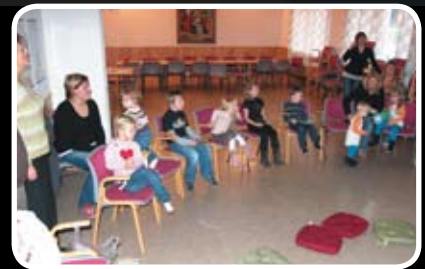
Sundagsskolen er starta opp att Les meir s. 5