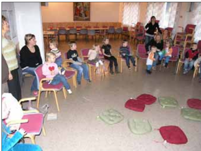
Barna på sundagsskulen er samla i halvsirkel

Fleire ivrige personar har starta opp sundagsskulen igjen. Sundag den 9. desember var det sundagsskule for andre gong i år på bedehuset på Austre Bokn.