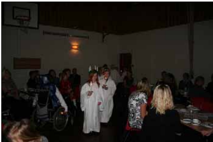
Her kjem Luciatoget inn i gymsalen

I gymsalen var det dekket med små bord med plass til alle sammen. Lyset ble slukket og 15 luciaer kom inn med levende lys. Meget stemningsfullt og sterkt var inntrykket de gav oss. En flott start på det som skulle bli en fin kveld.