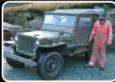
Militærjeep til hygge og nytte Les meir s. 4