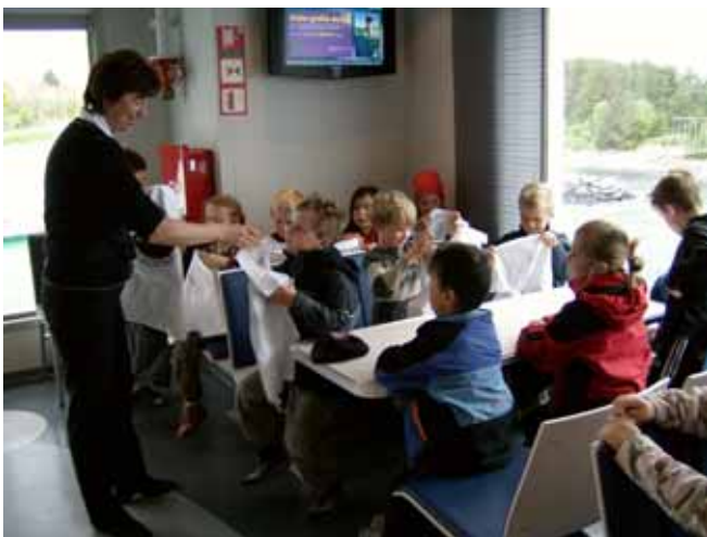
Her får me utdelt flotte t-skjorter.

Tysdag 29. mai skulle me få premie. Me blei møtt av ein representant frå ferjeselskapet Fjord 1 på kaien i Arsvågen, for så å gå ombord i Stavangerfjord. Her fekk elevane først utdelt kvar si t-skjorta med bilde av ei gassferja og så kunne dei gå i kiosken og velga kva dei ville av mat og drikke. Dei fleste tok seg ei pølse og brus, men det var også dei som forsynte seg med frokostbrød og rundstykker.