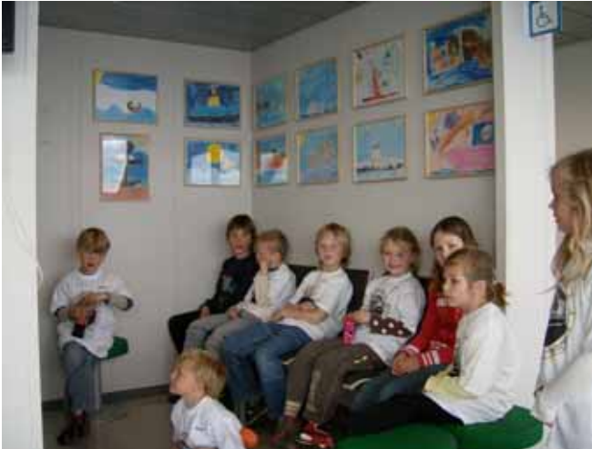
Ein del av teikningane på veggen.

I haust blei me invitert til å vera med på å utsmykka dei nye gassferjene mellom Arsvågen og Mortavika. Alle elevane i småskulen teikna flotte og fargerike teikningar som no er hengt opp på dei to ferjene Stavangerfjord og Mastrafjord.