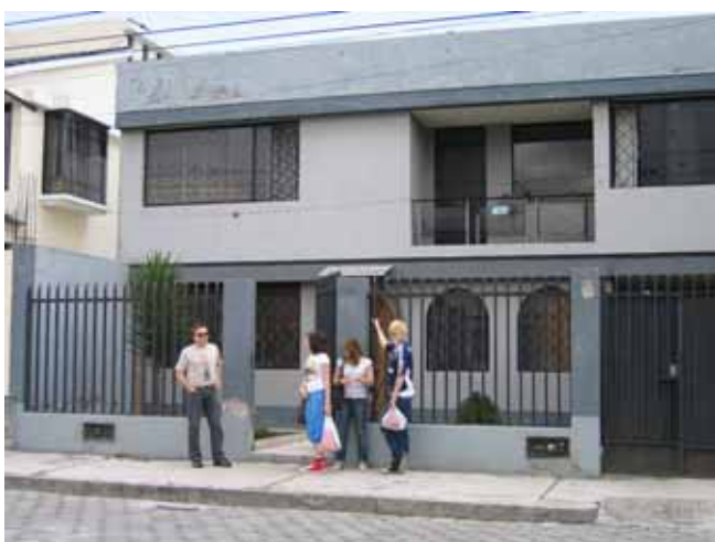
Foran huset til vertsfamilien. Legg merke til gitter foran vinduer og spisst gjerde foran. De som ikke har gjerde, murer høy mur med glasskår på toppen

Jul og nyttår før forbi utan særleg heimlengsel. Ved jul var alt som normalt: Heime med familien + beste-foreldre og eitt søskenbarn, eg hadde som vanleg mest presangar under treet, julegløgg og julekaker (detta takket være mamma sine oppskrifter og telefon.) Det heller uvanlege med jul må vel vere strålende sol og kongereker til julemiddag?