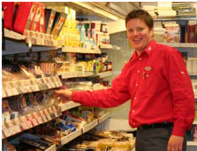
Kjøpmannen på Bokn.