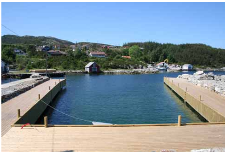
Snekkararbeidet er ferdig. Når tankannlegget for diesel, bensin og vatn kjem på plass, kan første båt leggja til.