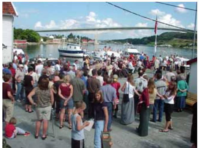
Mykje folk på Marknadsdagen 2002.

Det som ein har merka, er større etterspørsel etter bustader. Det er utan tvil fleire som søker etter bustad, men lite er å oppdriva. Det burde vore meir tilgang på ledige bustader. Annonser i tidlegare nr. av Bygdabladet tyder på at det er fleire som etterspør dette.