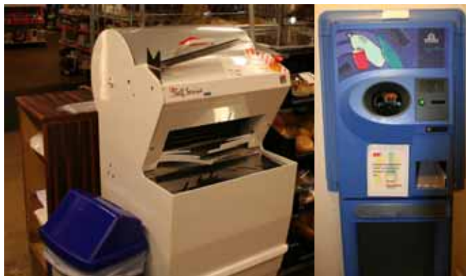
Brødskjæremaskin og panteautomat, høgteknologi blant tomat og salat.

Lag og organisjoner vil og delta med sitt, men alle detaljar rundt dette er ikkje klarert endå. Ein håpar at Andholm skal leggja til kai i regi av Båtforeningen.