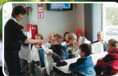
Premietur med Stavangerfjord. Les meir s. 15