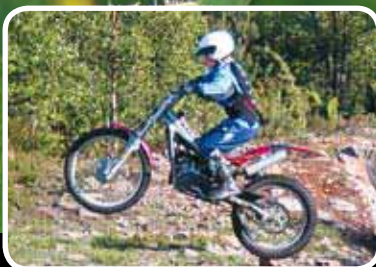
På trialtrening ved Knarholmen. Ser meir s. 6