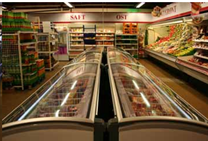
Med nye frysediskar er butikken godt førebudd for sommarvarmen.