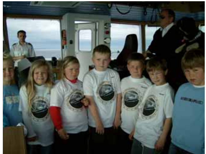
På omvisning i styrehuset med nye t-skjorter

Mens me satt og åt, blei me puljevis tatt med opp i styrehuset for å få sjå kor "sjefen" satt og styrte ferja. Her var det veldig god utsikt.