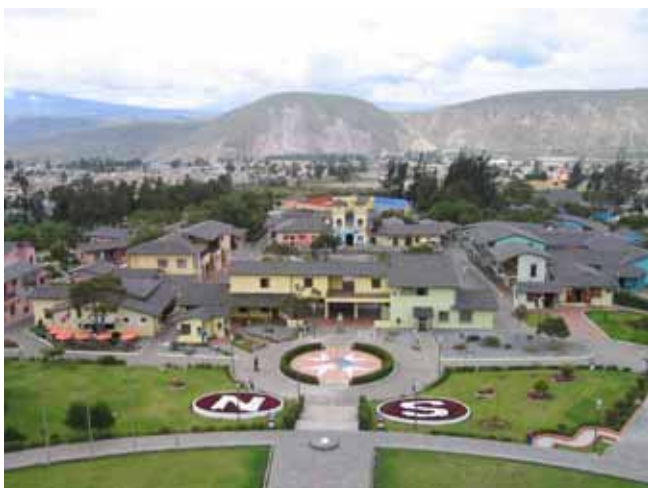
Ekvator som landet har fått sitt navn Ecuador fra.