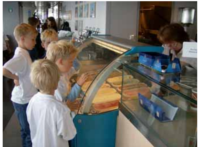
Masse god is i isbaren!

Til slutt blei heile festen avslutta med at alle fekk velga seg is frå isbaren, og her var det berre å velga mellom alle slag av kuleis eller softis. Etter to turar fram og tilbake mellom Arsvågen og Mortavika var alle fornøyde og me tok bussen tilbake til skulen.