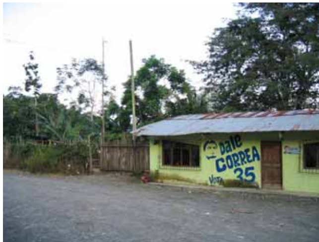
Slik driver de valgkamp i Ecuador.