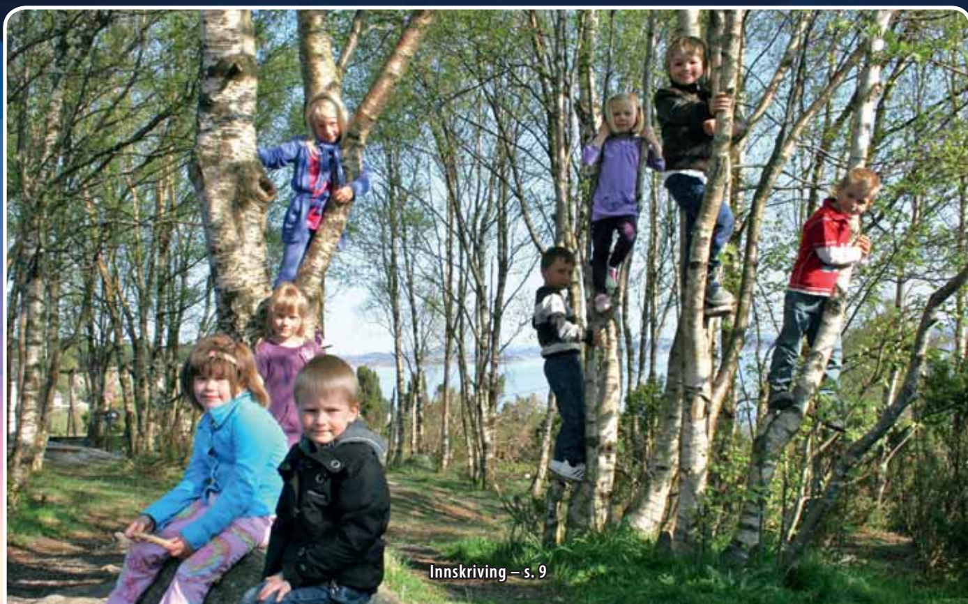
Innskriving – s. 9