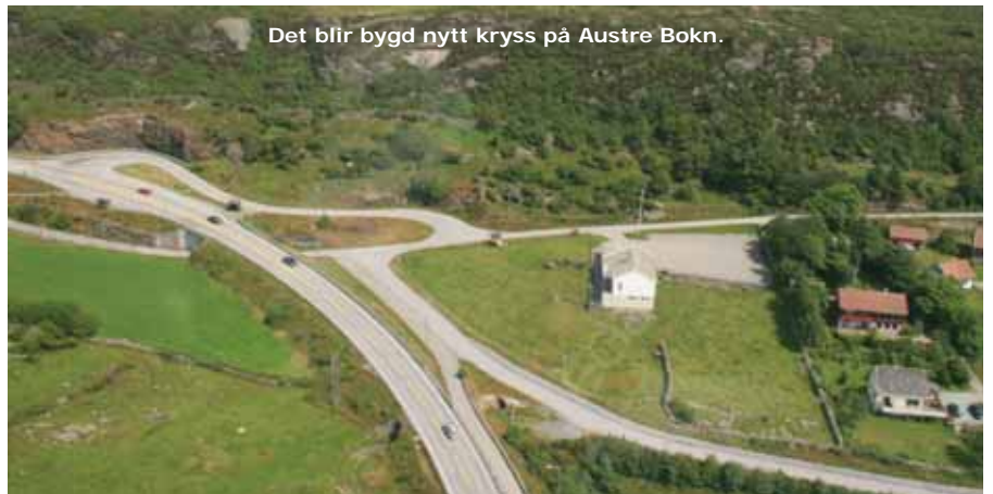
Det blir bygd nytt kryss på Austre Bokn.

På bakgrunn av dette er det difor gledeleg å kunne melda at Statens vegvesen gjennom nemnde drøftingar har kome Bokn kommune i møte og aksepterar dei vilkåra som Bokn kommune har satt i sitt kommunestyrevedtak. Dette inneber at det blir bygd nytt kryss på Austre Bokn. I samband med varsel om oppstart av reguleringsplan for E39 Rogfast i Bokn kommune, vil ein dermed også varsle oppstart av reguleringsplan av kryss på