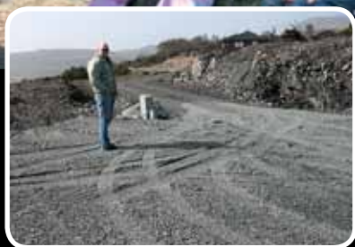
Store utbyggingsplanar - s. 5