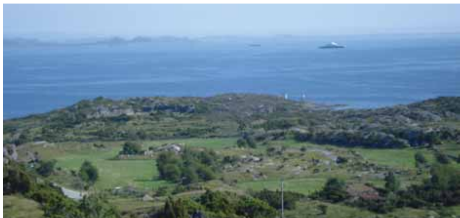
Panoramautsikt mot sør.