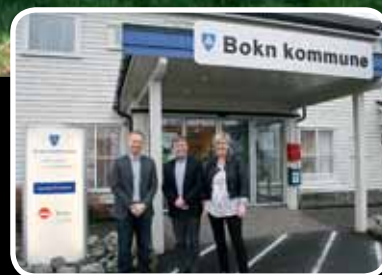
Nye tider - s. 23