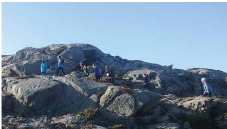
Mellom bakkar og berg ut mot havet spring vi lett – ja, litt svett.

Vi skal i kamp vi og; vi skal kjempa for