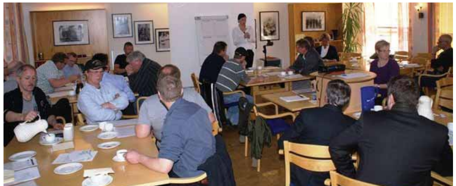
Frå Mulighetsarena Fiskeri og oppdrett i Bokn i april 2010.