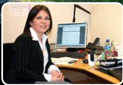
Folkehelsekoordinator - s. 12