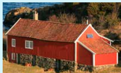
Det blir tur til Oksebåsen 15. juni.