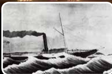
Med båt til Bokn, seriestart – s. 10