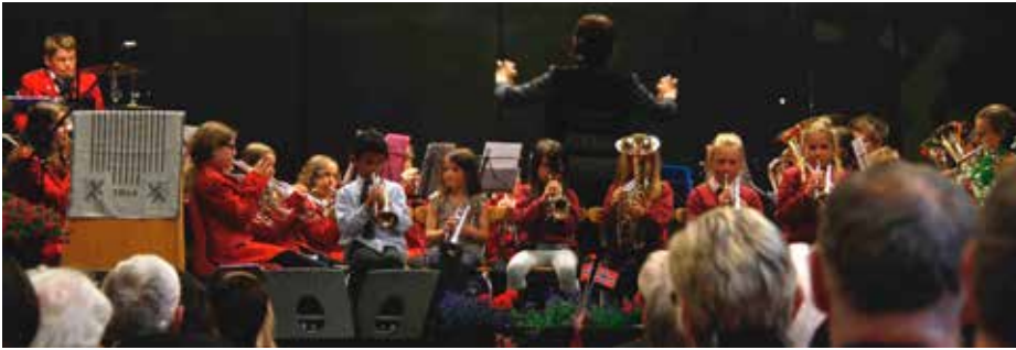
Bokn skulekorps med aspirantar opna jubileumsfesten.

narane tukta engelskmennene". Det to aktars-skodespelet var tilrettelagt for elevar frå 6., 7. og 8. klasse av Merete Alvestad, og dei hadde gjort ein kjempejobb sidan innøvinga star-