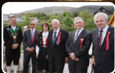
Dagen ein vil hugsa lenge – s. 3