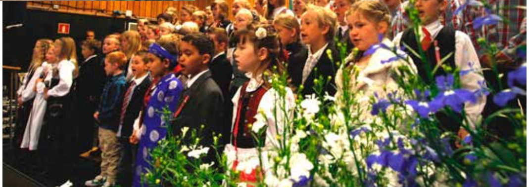
Mektig start på dagsprogrammet då eit stort skulekor song "Det går et festtåg gjennom landet" saman med Bokn musikkorps (bak).