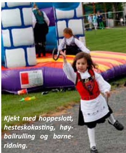
Kjekt med hoppeslott, hesteskokasting, høyballrulling og barneridning.