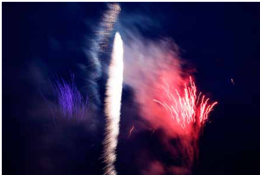
Fantastisk fyrverkeri i raudt, kvitt og blått.

Så var det dans med «The Kvednabekkjers» til kl. 02.00. For andre gong på kort tid storkoste bandet seg på scena, og skal ein tru allsongen og stemninga så koste folk seg i salen også.