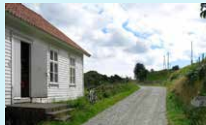
Bokn bygdemuseum vil ha sommarope 29. juni - 10. august kl. 13.00-16.00.