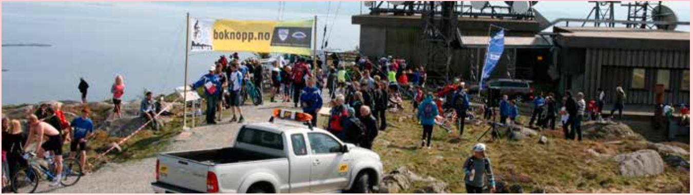
MYKJE FOLK PÅ TOPPEN: Vil BoknOpp runda 100 deltakarar neste år?

fint, seier ei som håpar dei har ufarleggjort løypa litt.