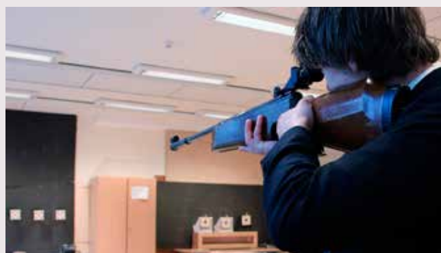
Skytterlaget arrangerer luftgeværskyting på 17. mai hvert år. Her fra 2013.