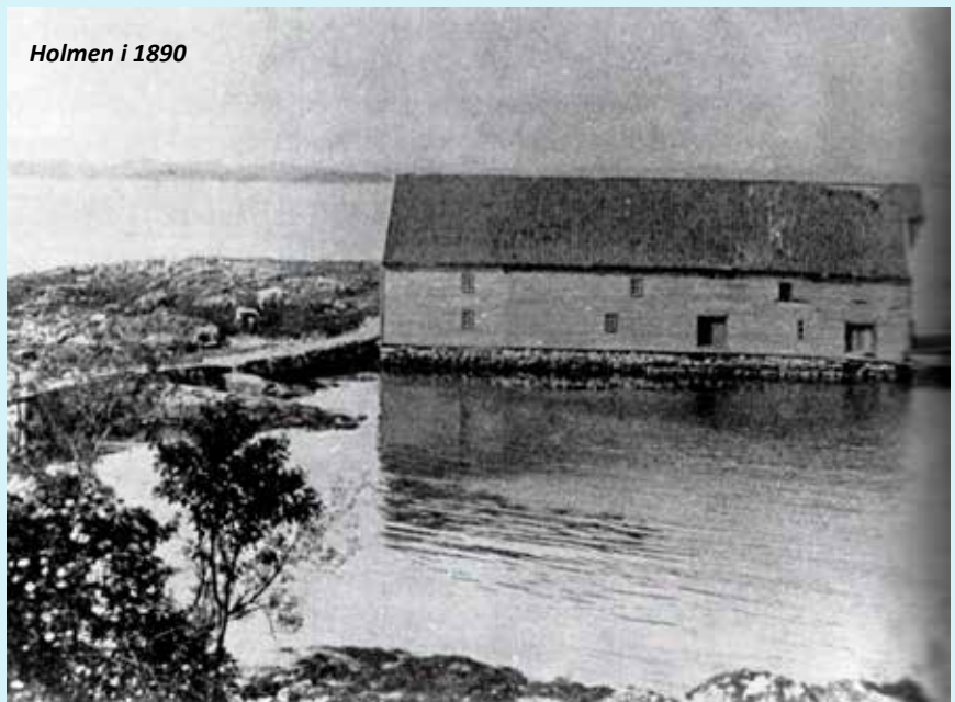
Holmen i 1890

7.november og gjekk sidan i ti år som einaste passasjerskip i Rogaland i rute, men utan å ha Føresvik eller Bokn i rutenettet og utan at kommunestyret tok noko initiativ.