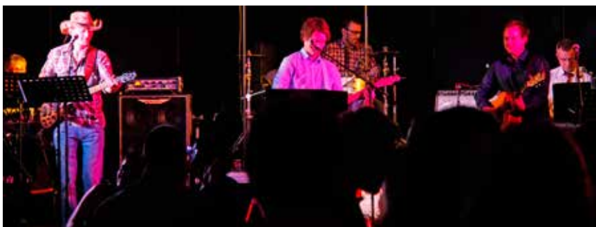
“The Kvednabekkjers” spelte opp til dans til slutt. Grunnlovsfeiringa var over kl. 02.00.