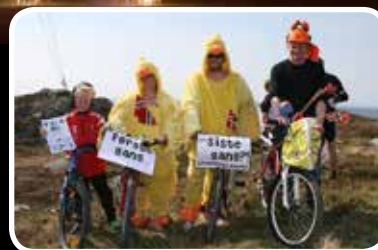
BoknOpp 2014 – s. 22