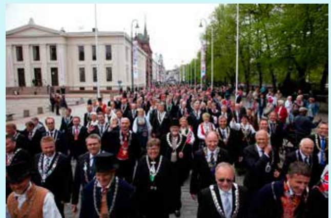
Frå ordførarmarsjen opp Karl Johans gate.

Stortinget, jubileumsmøte i Stortinget og fest på Eidsvoll's plass. Jubileumsdagane blei avslutta med ordførarmarsj opp Karl Johans gate til Det Kongeleg slott der Kongen og heile kongefamilien heldt mottaking for ordførar-korpset.