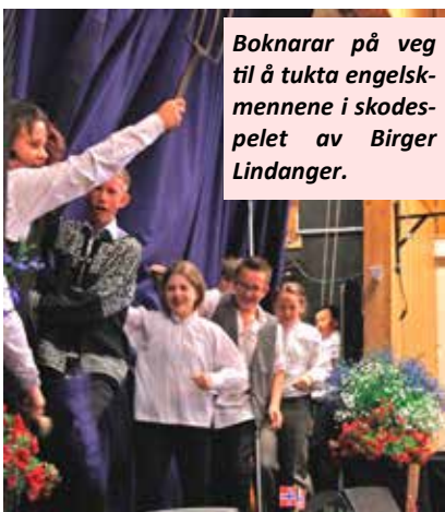
Boknarar på veg til å tukta engelskmennene i skodespelet av Birger Lindanger.