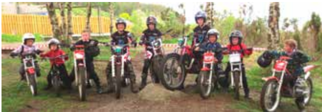
Pluggen Motorklubb var på plass med trialoppvisning.