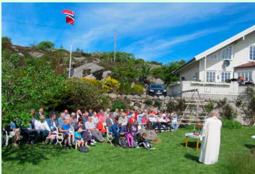
Ny rekord. 74 til gudstenesta i Loten.

Etterpå tende verten opp grillen, og grillsakene kom fram. Det vart kaffi og grillmat. Folk samla seg rundt bordene og praten gjekk. Mens andre vand-