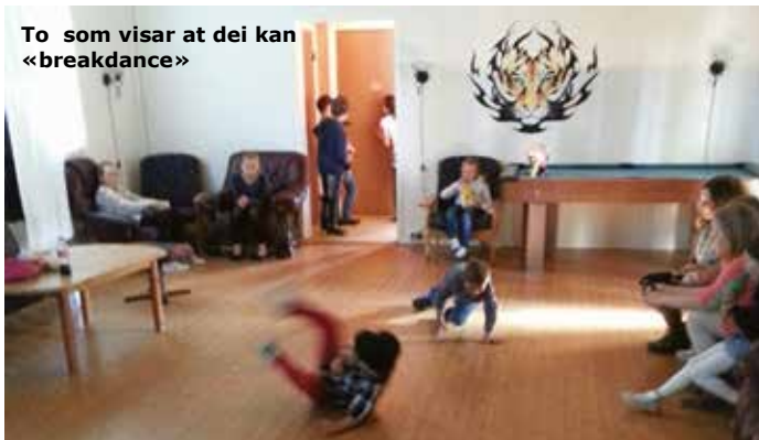
To som visar at dei kan «breakdance»

Heile 50 stk inkl. Petra-styret var på juniordisko. WOW for eit oppmøte:)