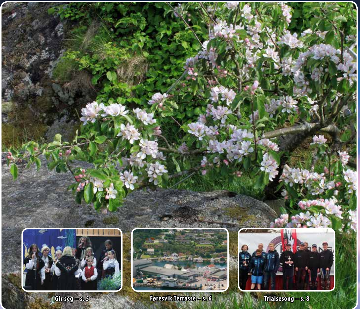
Gir seg – s. 5