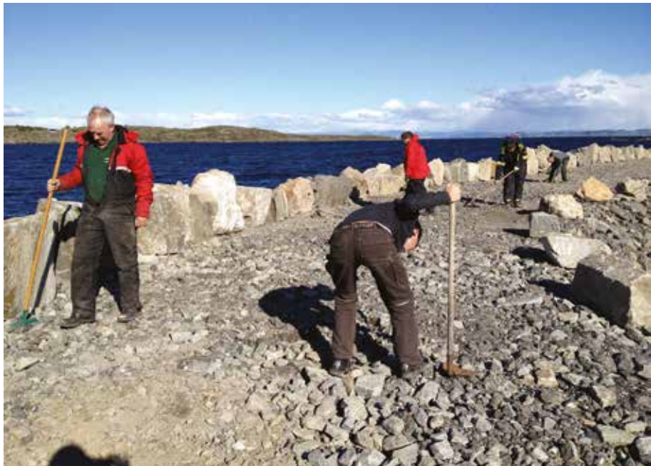
Det er lagt ned mange dugnadstimar i Hålandssjøen. Her frå dugnaden 23. mai.

I slutten av mai blei det kjørt ut singel på sjølve moloen. I tillegg blei delar av vegen ned til hamna grusa opp, og det blir nå lagt til rette for ein gangveg i aust til Knarholmen. Det er elles yn-