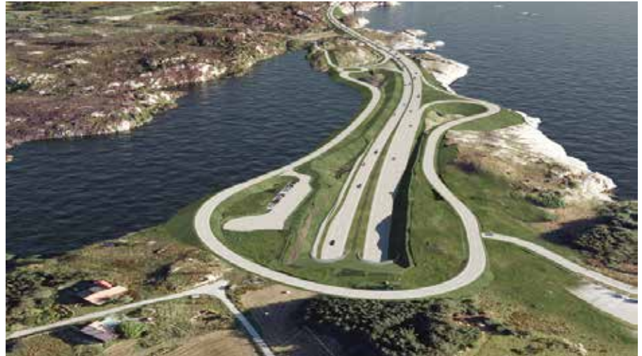
Arsvågen i Bokn Illustrasjon: Statens vegvesen/Cowi as

Spørsmålet om stigningsforholda i tunnelane er tatt opp både i referansegruppa for Rogfast og med prosjektleiinga i Statens vegvesen og ein var