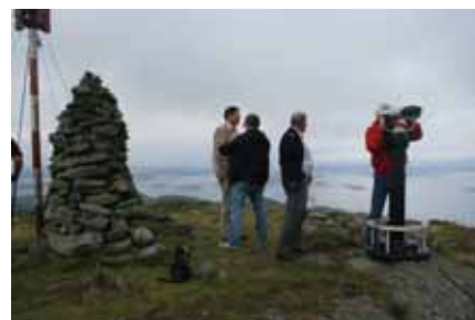
Varden - og den nye kikkerten.