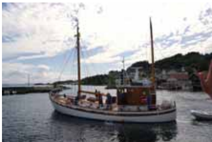
Takk for denne gong, Lindebjerg!

På bokn.no under Bilder finn ein 100 bilde frå dagen, som interesserte kan lagra/skriva ut. Hugs å klikka på minibildene (for å gjera dei større) før lagring/utskrift.