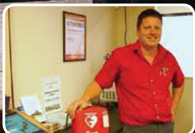
Hjartestartar på Coop Marked Bokn – s. 3