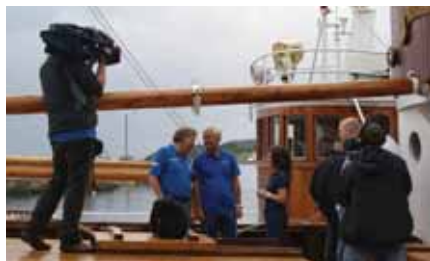
- Og;kjør film!

De tingene vi ønsker å vise er i prioritert rekkefølge: Noe næringsvirksomhet. (Hva driver de med her?) Spesiell kulturhistorie. (Det var her...) Interessante mennesker, gjerne knyttet til noe aktivitet. Dette er "direkte-TV" der handlingen er fremdriften.