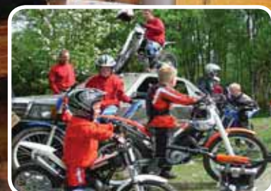
Norgescup og kretsmeisterskap – s. 14