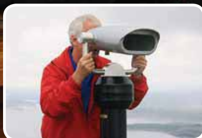
Utsiktspunkt Boknafjell – s. 8