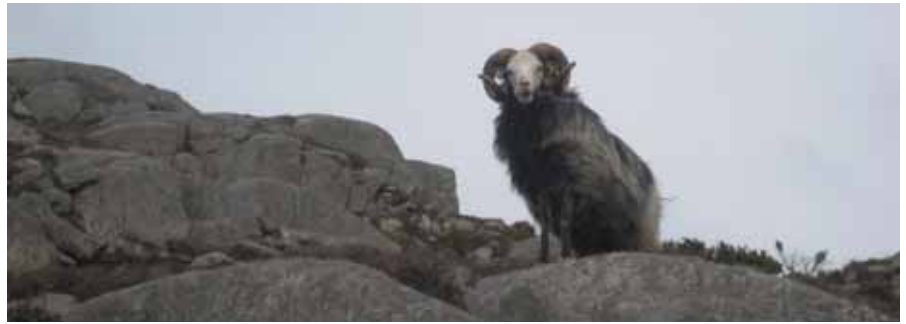
- Godt jobba; de er flinke.

Så skal vi som vert att heime, ta turen via Borgenvik og Boknahove og heim att til Føresvik.