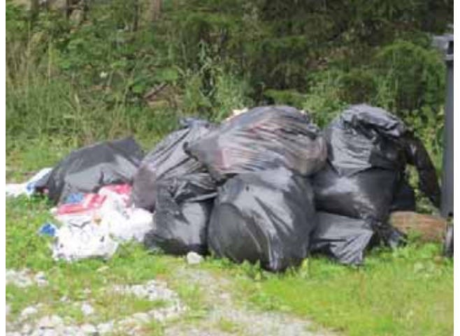
Renovatørene er ikke forpliktet til å fjerne svarte bossekker som er satt ved siden av spannene.