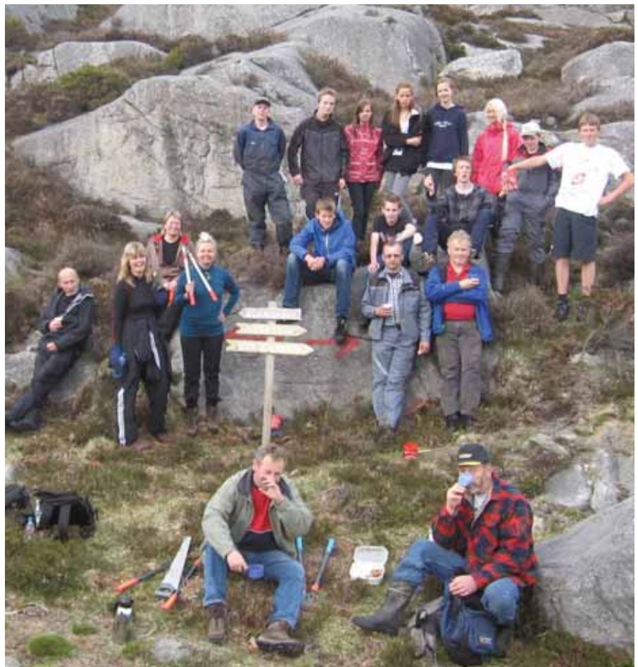
Heile dugnadsgjengen samla.