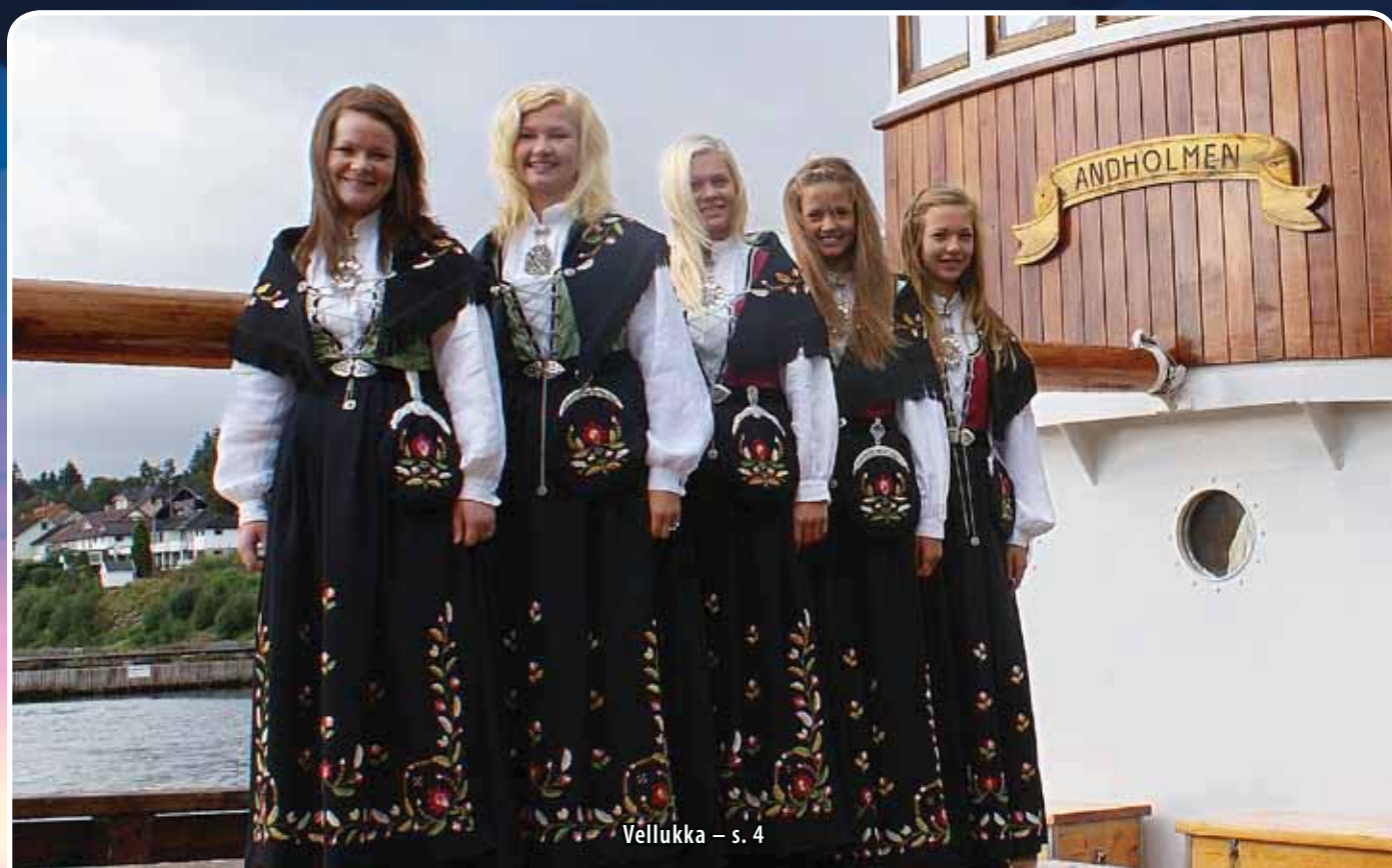
Vellukka – s. 4