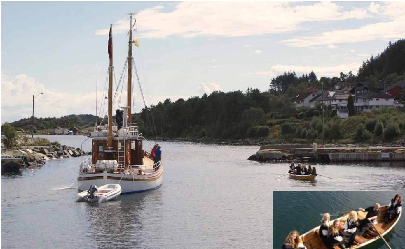
"Hardsjø", "Boknabåten" og jentene..