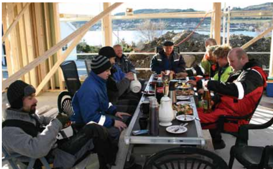
Snikkarar, folk frå grunnarbeidet og eigarar samla til kranselag.

Akkurat nå er det lite tomter i kommunen, ei stor utfordring.