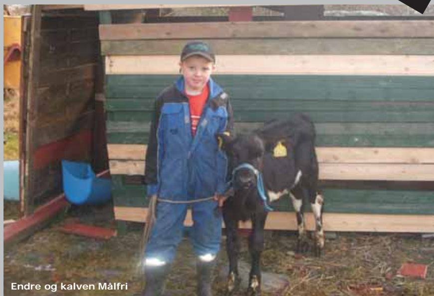
Endre og kalven Målfri

I vinter må eg for det meste vere inne, men til våren skal eg ut på beite og hoppe og danse, og ete