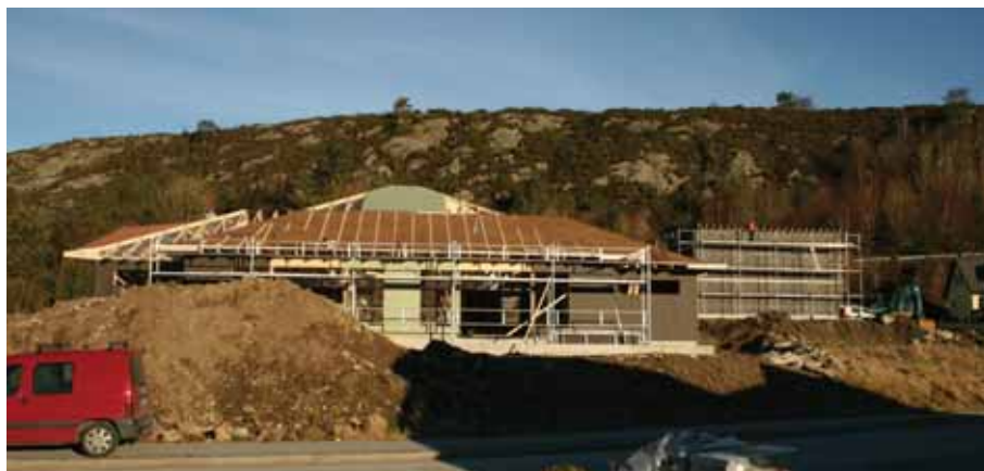
18.11.10: Huset ligg fint til nord i Øyrenfeltet.