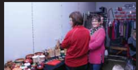
Glimt frå julemarknaden.

Jon Eiksund, fødd 16.04.40, døydde 15.10.10, 70 år gamal.