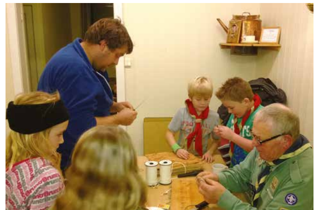
Ivrig er dei både store og små.

skal tidleg krøkjast som god krok skal bli», seier ordtaket. Siste skot på stammen er familiespeiding. Det står respekt av