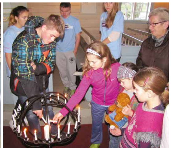
Lystenning i globen på avslutningssamlinga.

Samlinga avslutta med at borna hadde framvising av songen, LysVåken, og at