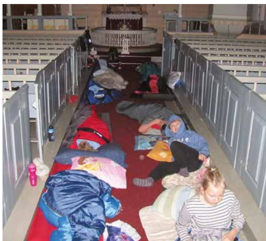
Soveposane ligg tett oppover midtgangen.

Det gjev unekteleg ei spesiell oppleving å liggje i midtgangen i