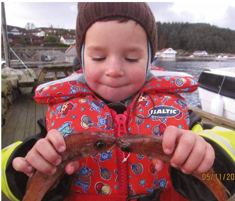
...de er kjæresten...