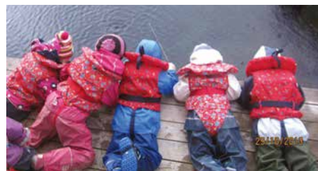
Vi liker å fiske.