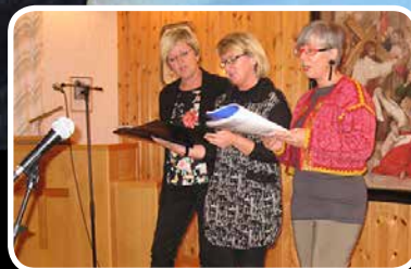
Kulturkveld – s. 5