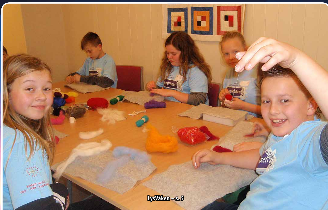
LysVåken – s. 5