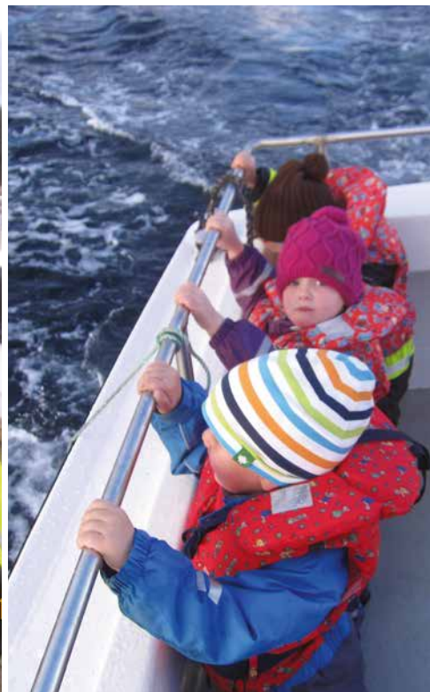
Det er fint å være på sjøen.