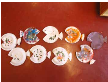
Vi lager fisker.

I samarbeid med "Kjekt på Bokn" har vi hatt prosjekt om fisk, skalldyr, og sunn kost i barnehagen.