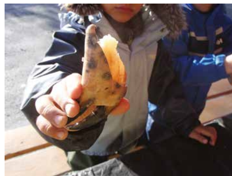
Vi liker krabbe.