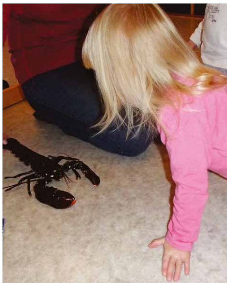
På Småtroll er vi nyskjerrige.