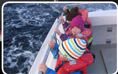
Fiskesprell – s. 3