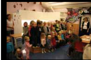
Stort forsidebilde: Kunstkafé

Heilside kr. 625,- Halvsida kr. 375,- Kvartside kr. 188,- 1/8 side kr. 125,- Privatann. kr. 62,- Fastann./fargeann. etter avtale