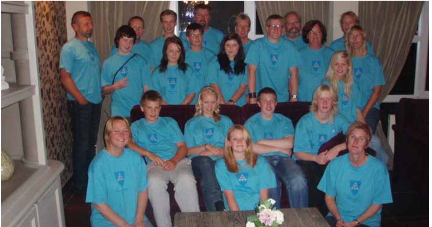
Heilen gjengen samla før middag, første overnattingsstad, Landhotel Spornitz i Tyskland.