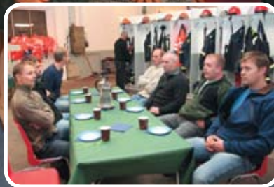
Ny brannstasjon s. 3