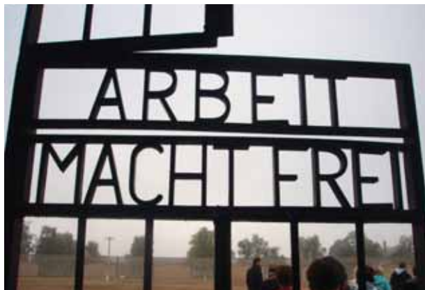
Porten inn til KZ Sachsenhausen, kor dei fleste av dei norske fangane satt.

Da vi gikk bort til den eldste delen av leiren, fikk vi se hus lagd av murstein. Jeg trodde først at her hadde SS-