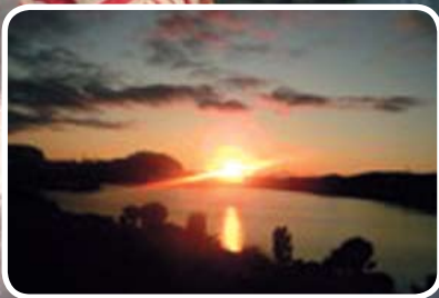
Solnedgang over Arsvatnet s. 2