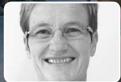
Korleis skapa næringsvekst? s. 5