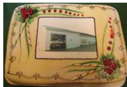
Ei flott marsipankake med bilde av den nye brannstasjonen var innkjøpt til markeringa av den nye stasjonen.