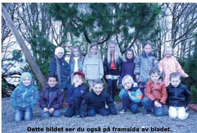
Dette bildet ser du også på framsida av bladet.

Desse skreiv seg inn på Bokn skule 27. april: