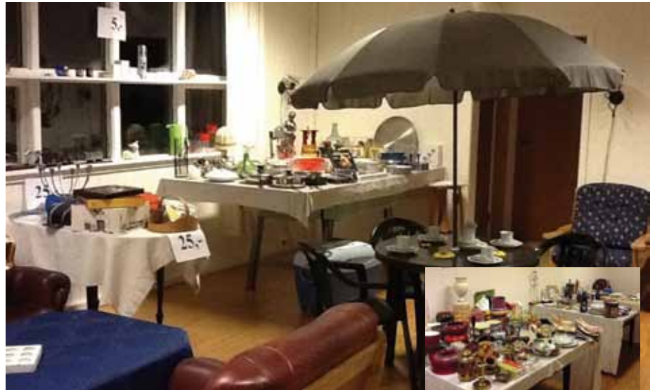
3807 kroner fekk me inn denne laurdags ettermiddagen.

Så nok ein gong, tusen takk til alle som har bidratt til loppemarkedet vårt. Og ikkje minst tusen takk til dei som baka til oss! Me sel og litt mat og drikk på loppemarknadene, og det blir koseleg og litt kaféaktig med god