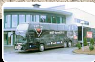
MOT-konsert – s. 5