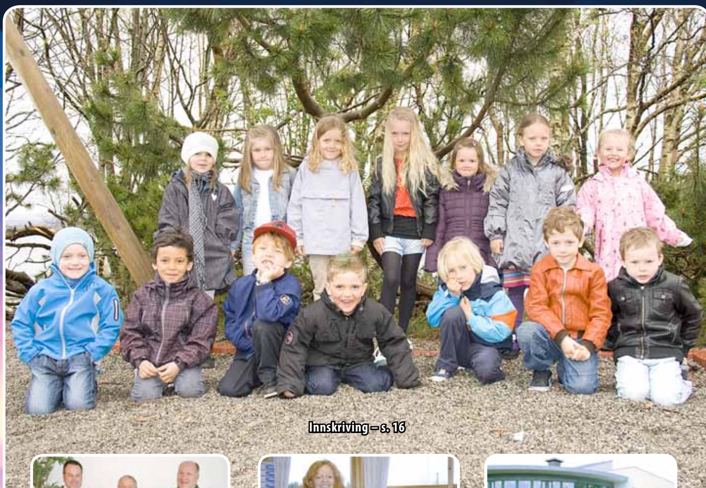
Innskriving – s. 16