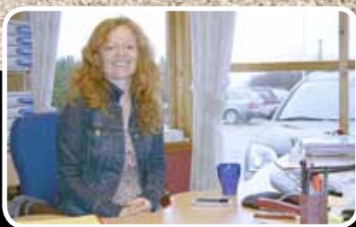
Ny seksjonssjef – s. 4