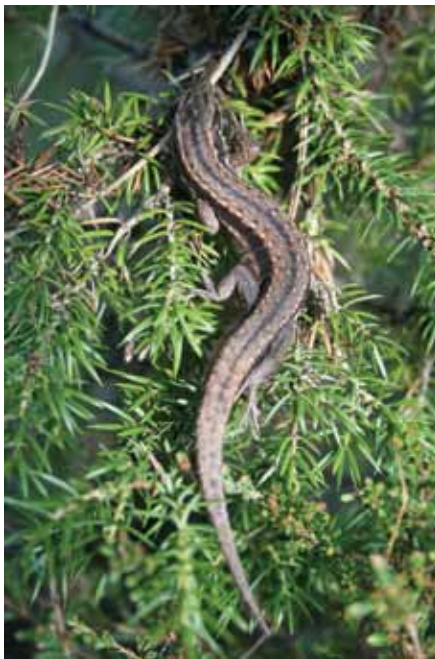
Varmar seg i vårsola i Havnavegen.