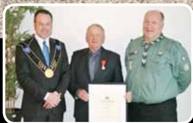
Kongeleg utmerking – s. 3