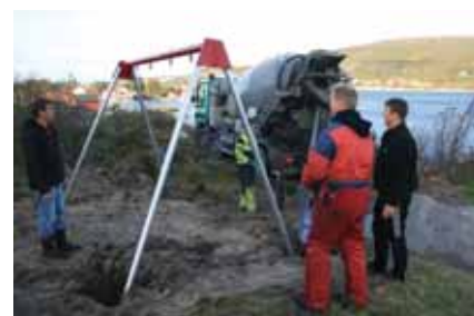
Montering av reilestativ.

Det er framleis mange barn som soknar til denne leikeplassen, sjølv om husstandane i kjerneområdet nå har