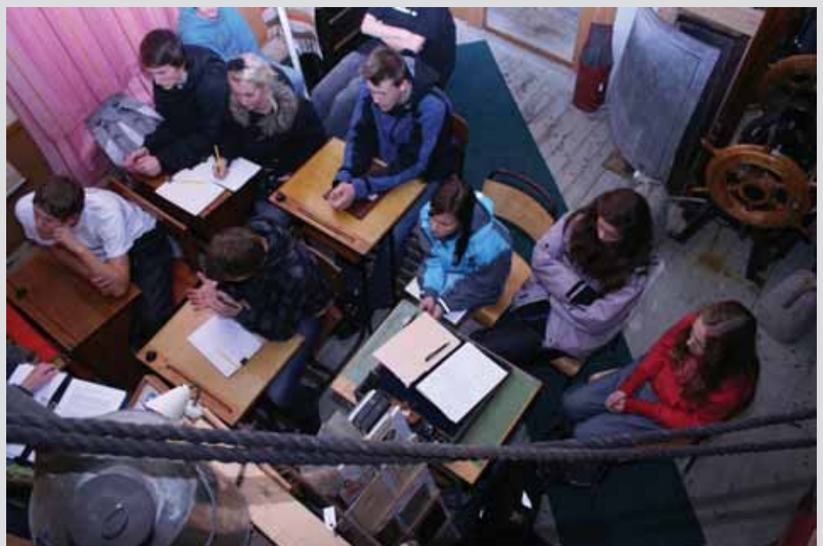
Meir eller mindre engasjert ungdom.

Elevane deltok og såg ut til å trivast svært godt med dette. Etter denne runden var klassen samla igjen og fasit