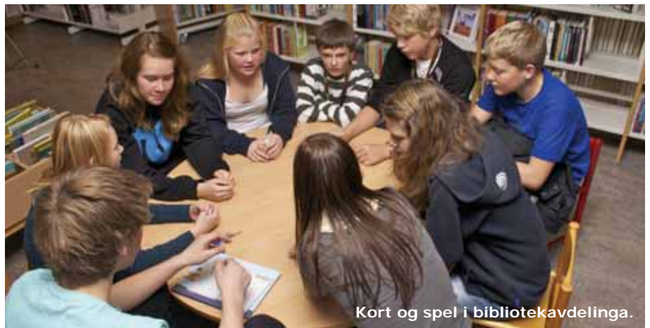
Kort og spel i bibliotekavdelinga.