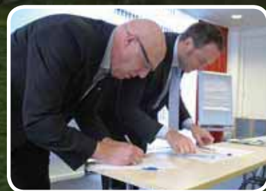
Partnerskapsavtale – s. 14