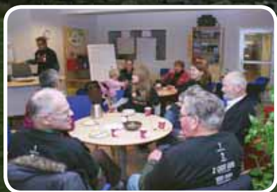
Innsamlingsrekord – s. 4