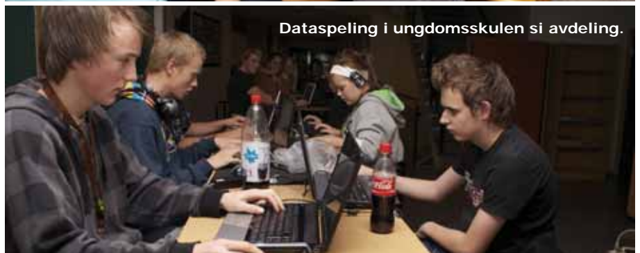
Dataspeling i ungdomsskulen si avdeling.