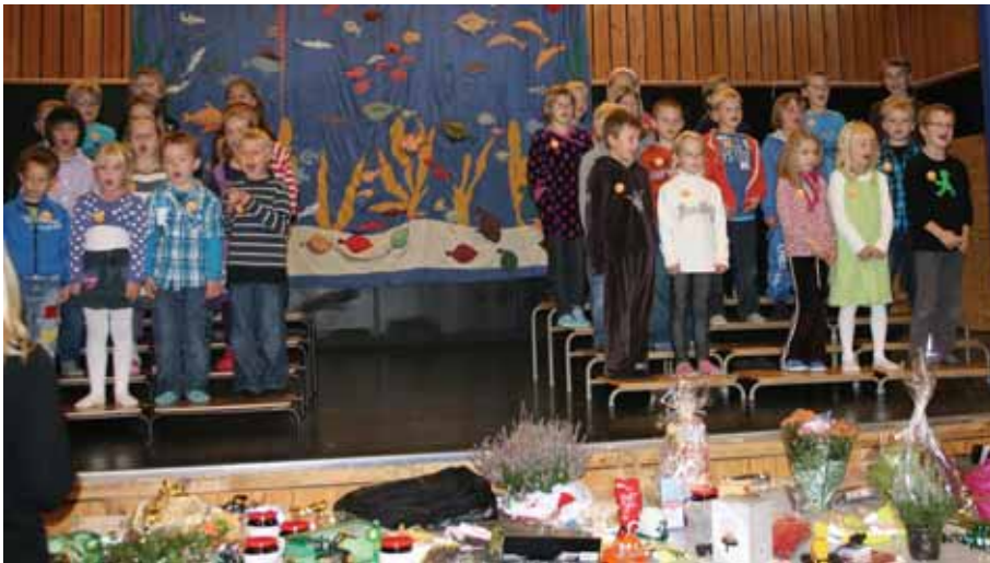
Småskulen starta basaren med kor frå scena.