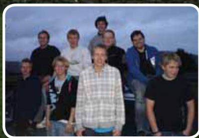
Gatebilklubben – s. 6